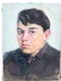
Т. Карибжанов, портрет, масло, 1961 г.