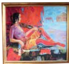
К. Нурбатуров, «Миражи», холст, масло, 2011 г.