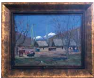
Т. Карибжанов, масло, 1953 г.