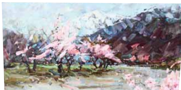
А. Селин, «Цветущая долина», холст, масло, 2008 г.