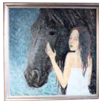
К. Нурбатуров, «Наваждение», холст, масло, 2012 г.