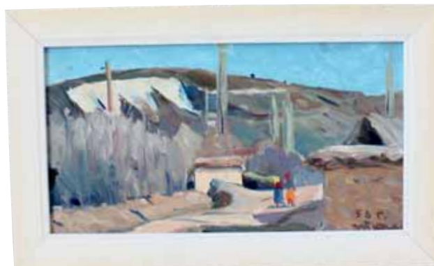
Т. Карибжанов, масло, 1953 г.