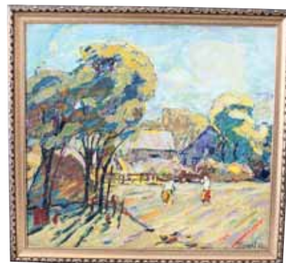
Г. Донцов, масло, 1967 г.