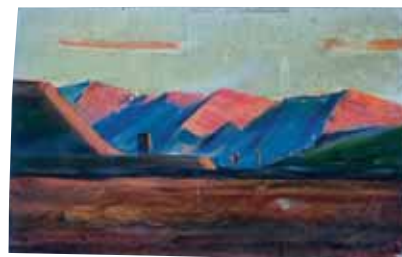
Т. Карибжанов, масло,