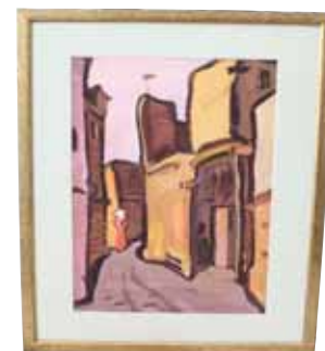
А. Школьный, «Бухара», 1970 г.