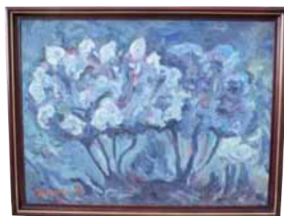
Ж. Шарденов, холст, «Сирень», 1987 г.