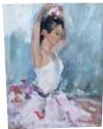
Мое маленькое приобретение в Праге.

Открытка моей пятилетней дочери, которая продавалась на благотворительном аукционе в AIS