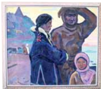
А. Школьный, холст, масло, 1963 г.