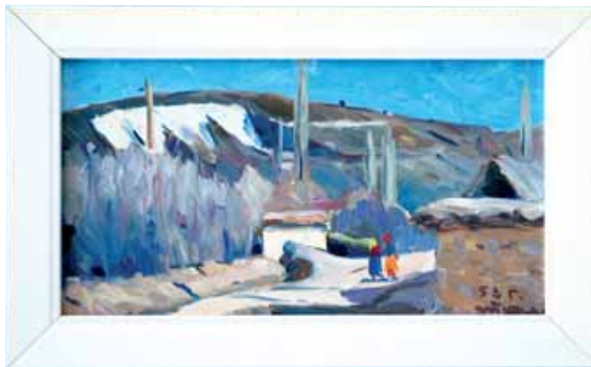
Т. Карибжанов, масло, 1953 г.

Обладать – не самое главное, важнее понимать, что мы всегда можем соприкоснуться с великими полотнами. ■