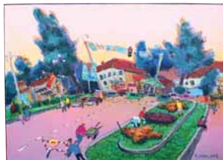
А. Уткин, «Сиреневая улица», холст, масло