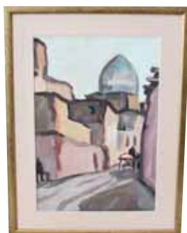
А. Школьный, «Хива», 1968 г.