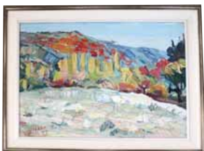
Ж. Шарденов, «Неожиданный снег в горах»