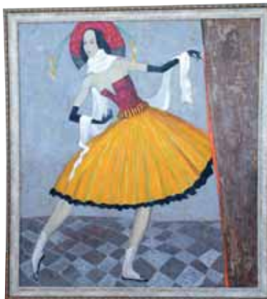
Канат Нурбатуров, масло, 2012 г., эту картину брат писал с меня