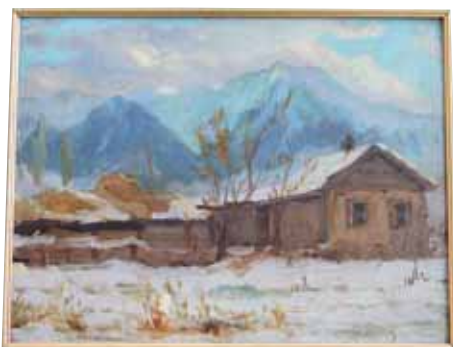
Г. Айтиев, масло