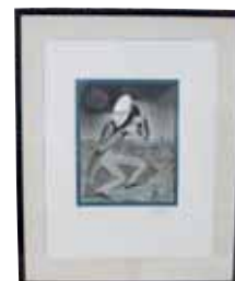
М. Шемякин, литография, 1985 г.